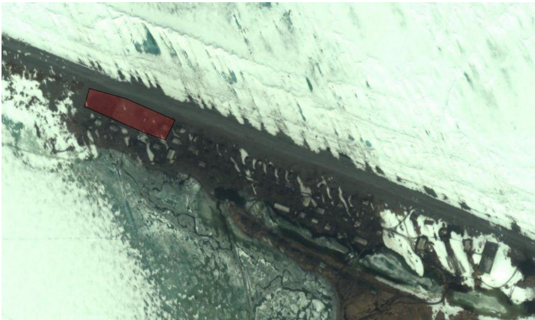
Рис. 2 – Зона действия котельной с. Инчоун.